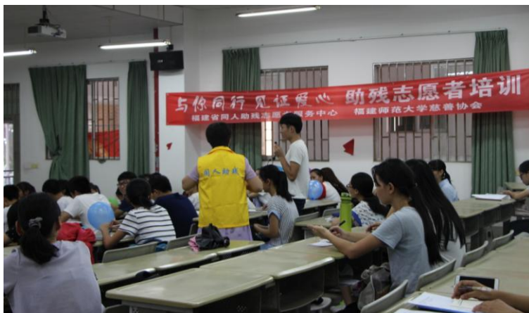
潘老师和学生互动

培训过程中，同学们与老师进行了积极的互动。新生们刚接触志愿服务还处在懵懂的状态。他们需要一个良师来指导。培训结束后，许多同学表示受益良多，希望能够参与其他助残技巧培训，提升自己的助残水平。