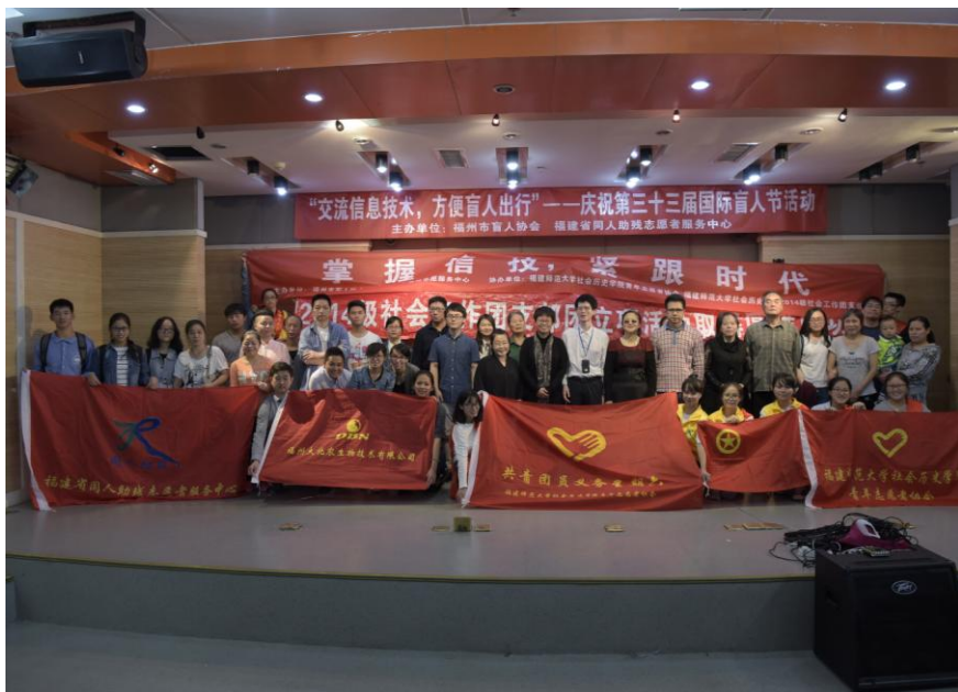
盲人和志愿者合影

为了迎接第三十三届国际盲人节，2016年10月12日下午，由同人助残、福州市盲人协会主办，福建省少年儿童图书馆、福州大北农生物技术有限公司、福建师范大学社会历史学院青年志愿者协会、福建师范大学社会历史学院2014级社会工作团支部协办，在福建省少年儿童图书馆开展“交流信息技术，方便盲人出行——庆祝第三十三届国际盲人节活动”。