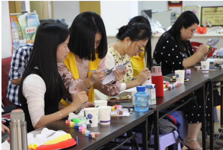
志愿者协助学员制作面具

10月30日,由同人助残、君龙人寿福建分公司主办,闽江学院美术学院协办的“2016年‘爱·艺’手工坊——面具手绘技能培训”正式开班。