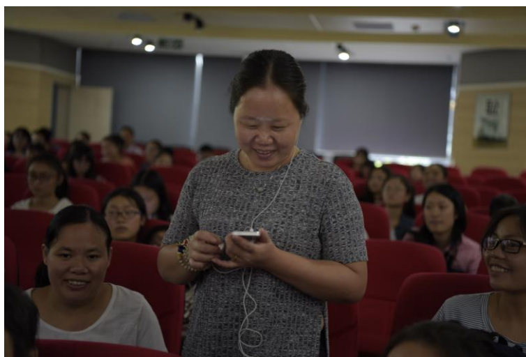
盲人朋友用微信抢红包

活动过程中，盲人朋友还用智能手机进行了多轮微信抢红包活动。视力障碍人士通过这次交流与互动，深入了解了智能手机的使用功能，能够熟悉地使用各类应用软件，大大方便了自己的生活。